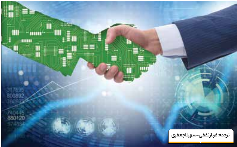
ترجمه: فرناز تقفی - سهیلا جعفری

در تد توضیح می‌ده که این کار شدنی است و برنامه‌های ساخته شده سریع و ارزان، راه‌های مؤثر جدیدی برای ارتباط شهروندان با دولتهای خود - و همسایگان نشان هستند.