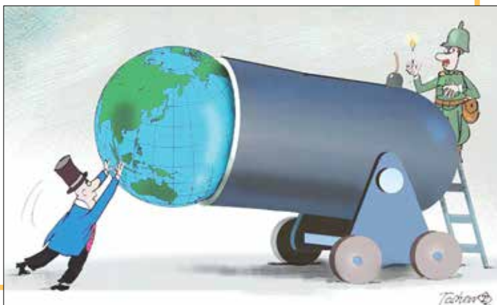
کارتون: توسو بور کوویچ-ایران کارتون

«صبر شادمانه» پوششی برای محافظت از خویش در برابر یخبندان‌های سنگین اجتماعی و سیاسی است. آنان که عجله می‌کنند و به جای آخرین شب پاییزی می‌خواهند خیلی زودتر پایان شب یلدا را جشن بگیرند، نهال‌های نارس را به اشتباه می‌اندازند و آنان را در معرض خواسته‌ها و انتظارات شتابزده بهاری قرار می‌دهند. انتظارات غیرواقعی و شتابزده مثل